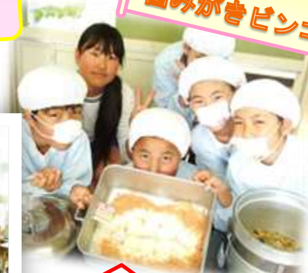
景品 くち型おにぎり!!